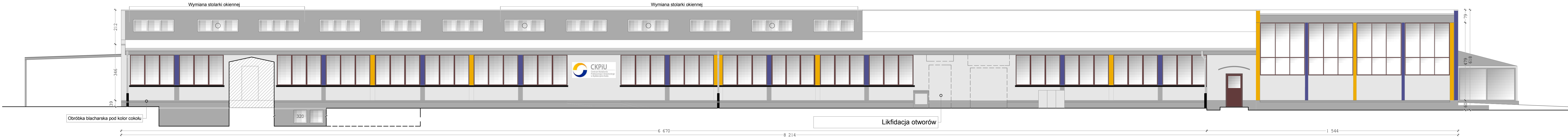
Elewacja wschodnia skala 1:100