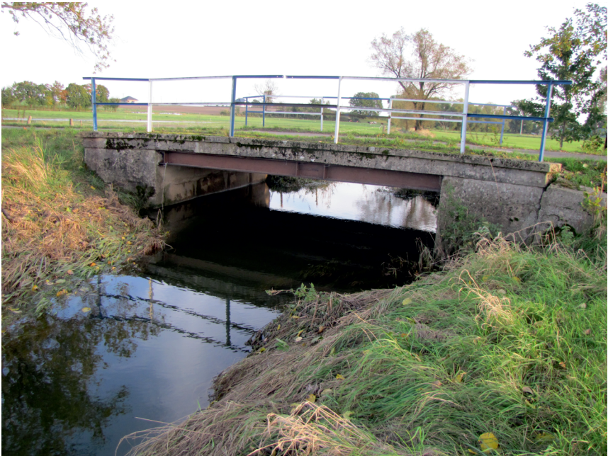
widok od strony dolnej wody