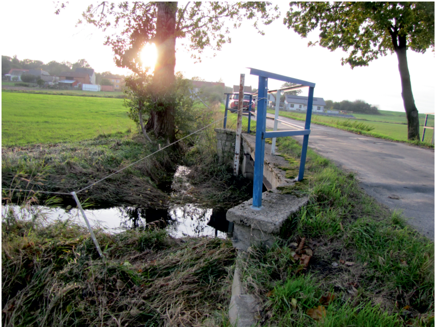
widok w kierunku Pociękarbia- wodomierz