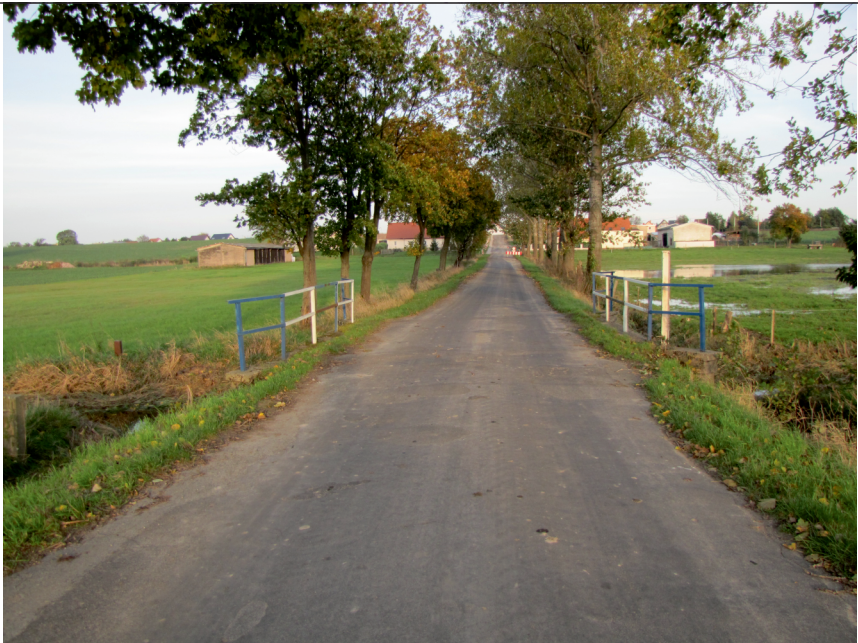
widok w kierunku Radziejowa