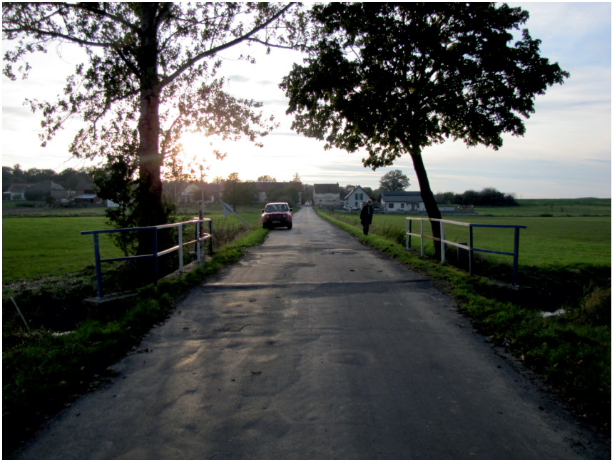
widok w kierunku Pociękarbia