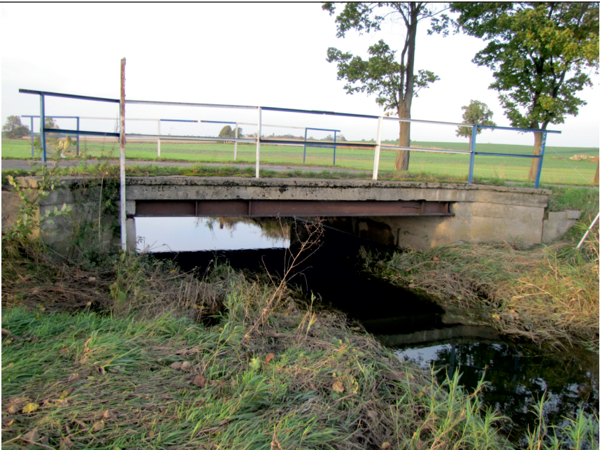
widok od strony górnej wody