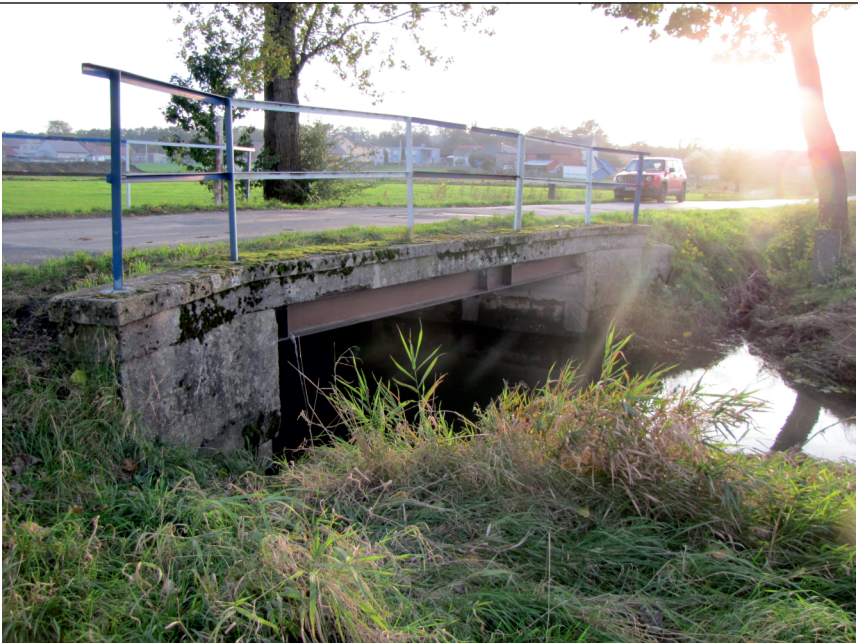
widok od strony dolnej wody w kierunku Pociękarbia