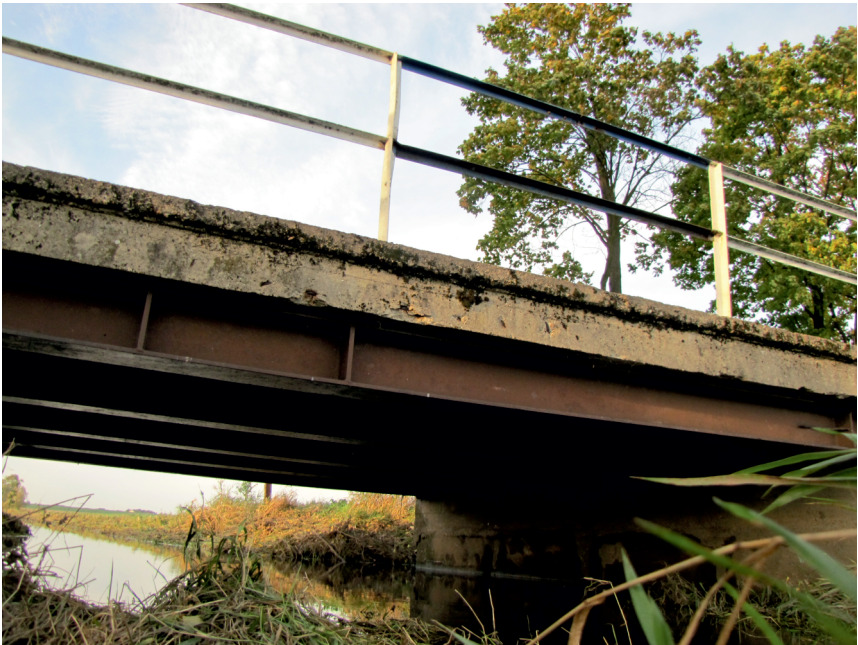
widok spodu konstrukcji od strony górnej wody