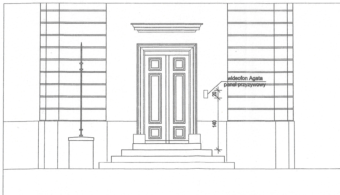
WIDOK WEJŚCIA 1:50