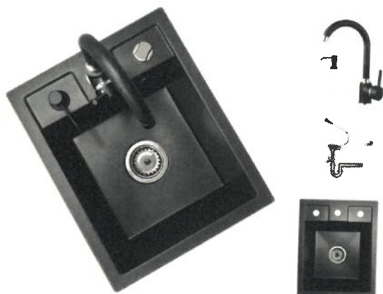
ZLEWOZMYWAK GRANITOWY JEDNOKOMOROWY SYFON AUTOMAT