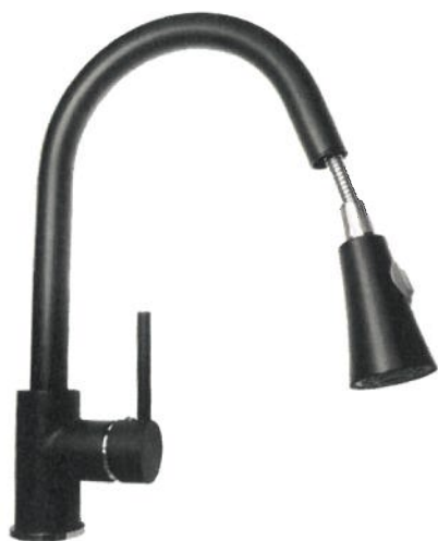
BATERIA KUCHENNA ZLEW GRANITOWY_ZLEWOZMYWAK KRAK

Lub wariantowo Bateria kuchenna z ruchomą końcówką do splukiwania