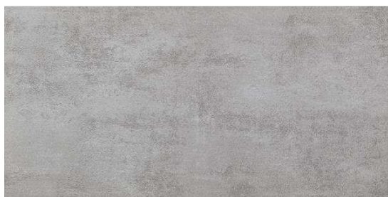
Płytki podłogowe Nowa Galla 30/60 cm.( lub zbliżona)