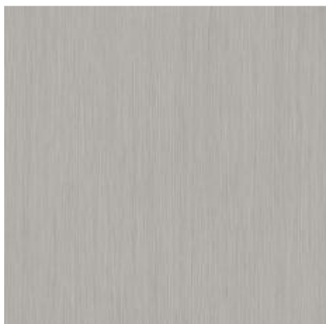
Tarkett-Meteor 55-70 Fiber Wood- Grey.