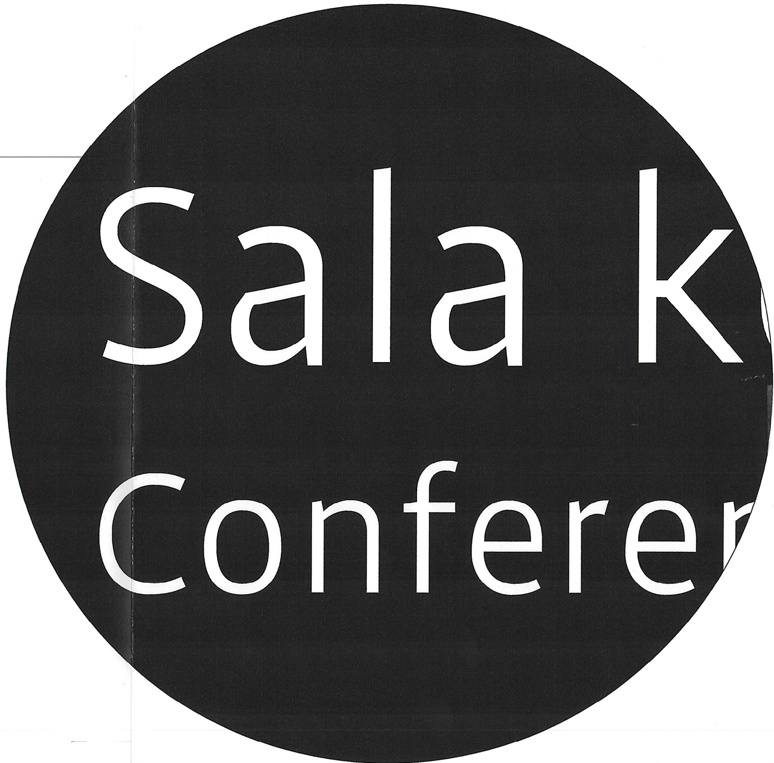
Znak B1-3, Strona S2 Detal, skala 1:1