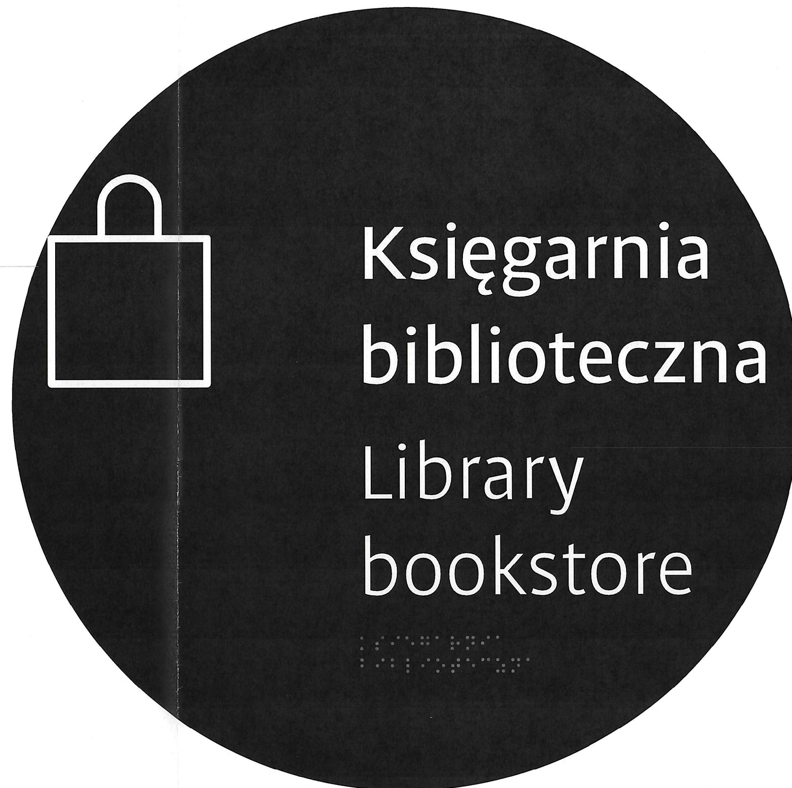
A2.2/ Oznaczenia pomieszczeń – Tablica montowana równolegle do ściany skala 1:5