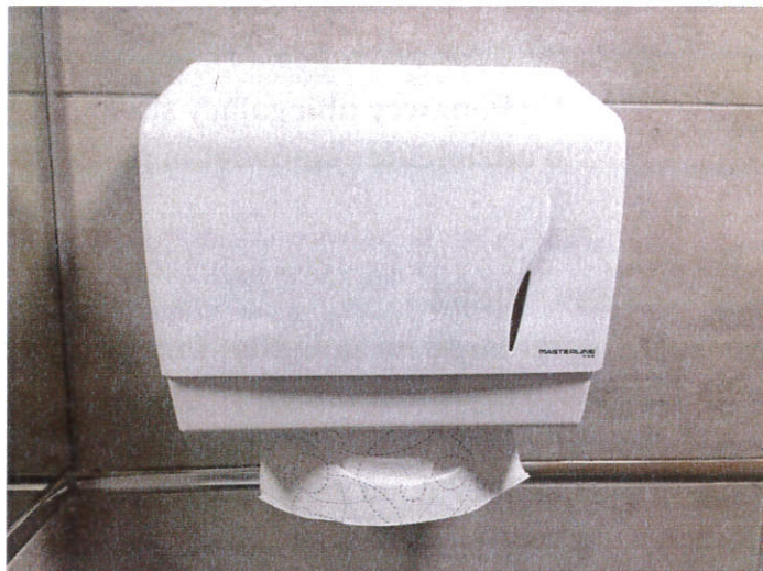
(pojemnik o standardowych wymiarach -ilość 5)

Zamawiający, przedstawia zamontowane w toaletach akcesoria: