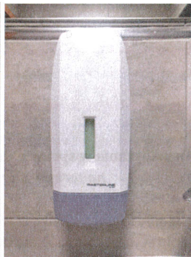
1 pojemnik – 0,7 L 4 pojemniki – 0,5 L