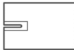
4 200 × 290 cm 1 szt.