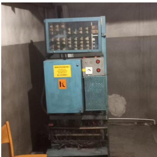
Zdj. 6 Szafa sterująca dźwigiem