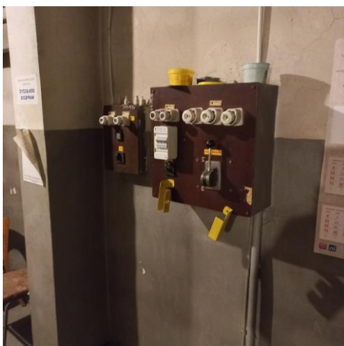
Zdj. 5 Tablica elektryczna windy