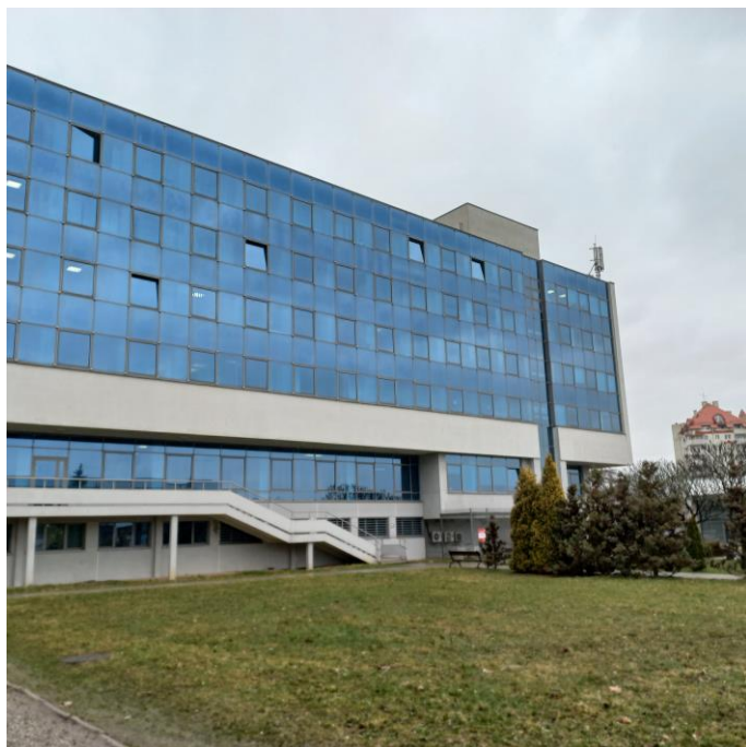
Zdj.1 Widok pionu budynku, w którym zlokalizowany jest dźwig przeznaczony do modernizacji

Budynek główny AWF Kraków zlokalizowany jest przy Jana Pawła II 78. W części administracyjnej w której znajduje się dźwig, budynek posiada 6 kondygnacji. Wysokość budynku wynosi ok. 20,96 m a z nadbudówką maszynowni: 24,16 m