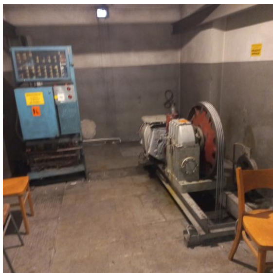
Zdj.7 Widok ogólny maszynowni

Maszynownia dźwigu znajduje się w pomieszczeniu nadbudowanym na dachu budynku. Drzwi maszynowni są drzwiami stalowymi. W maszynowni znajduje się napęd dźwigu oraz szafa sterowania pracą dźwigu.