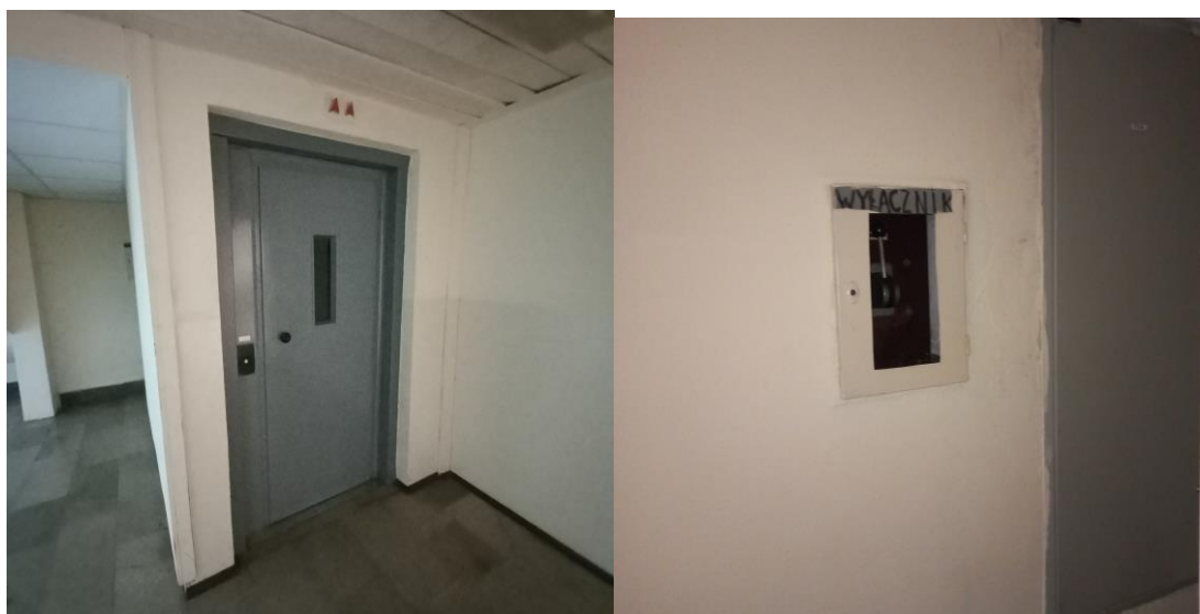
Zdj. 2 Drzwi windy na poziomie -1 oraz wyłącznik windy

Dźwig zamontowany jest w żelbetonowym, wewnętrznym szybie budynku w pobliżu klatki schodowej. Obsługuje 6 kondygnacje od poziomu -1 0 do piętra +4. Przystanki rozmieszczone są jednostronnie w kierunku korytarza (przystanki nieprzelotowe). Wysokość podnoszenia dźwigu wynosi 17,9 m, wysokość nadszybia 2,7 m , głębokość podszybia 1,72 m. Szyb windowy ma wymiary – wysokość ok. 15 m, głębokość 1,91 m, szerokość 1,715 m. Przystanki zlokalizowane są na każdej kondygnacji od -1 do 4 piętra (6 przystanki). Kasety przywoławcze umieszczone są w ścianie obok drzwi dźwigu.