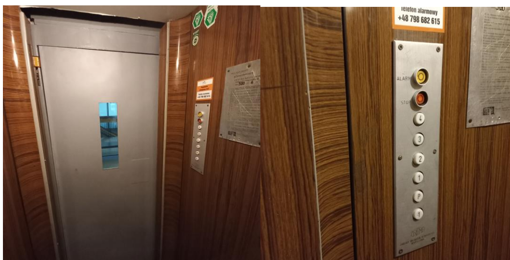
Zdj. 3. Wnętrze kabiny dźwigu wraz z panelem