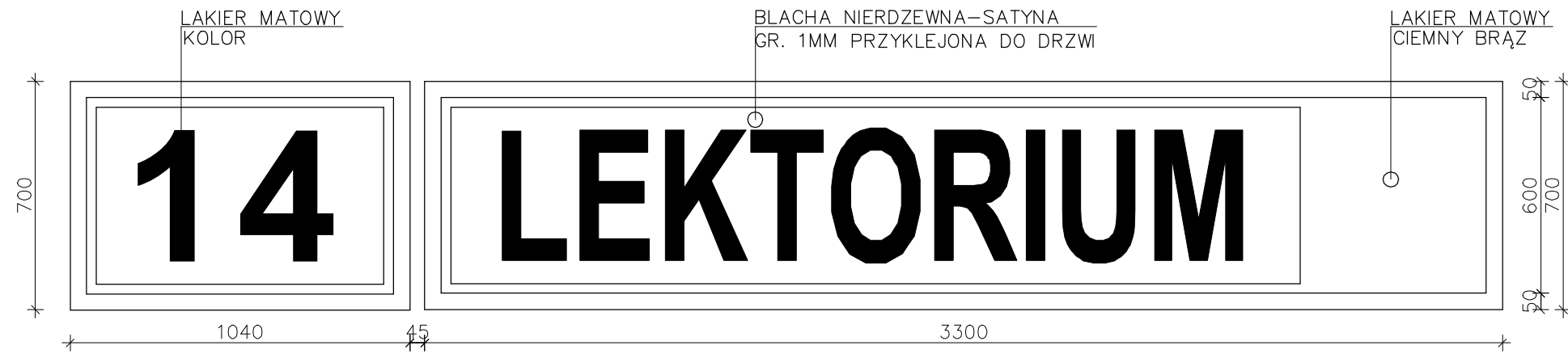
NUMER Z NAPISEM –PARTER SPOSÓB ZESTAWIENIA NUMERU Z NAPISEM SKALA 1:2