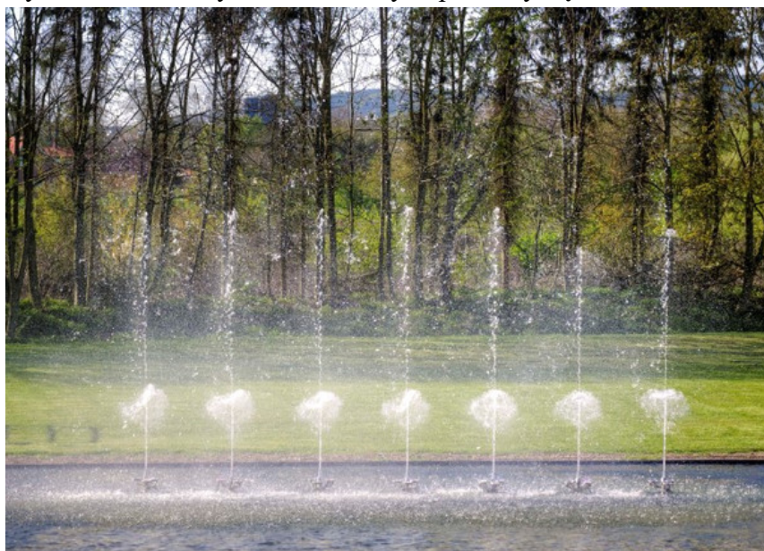
Efekt uderzenia – Splash Effect – H_{\max} = 1,5\text{m}

Przykłady obrazów wodnych realizowanych przez dyszę DF2: