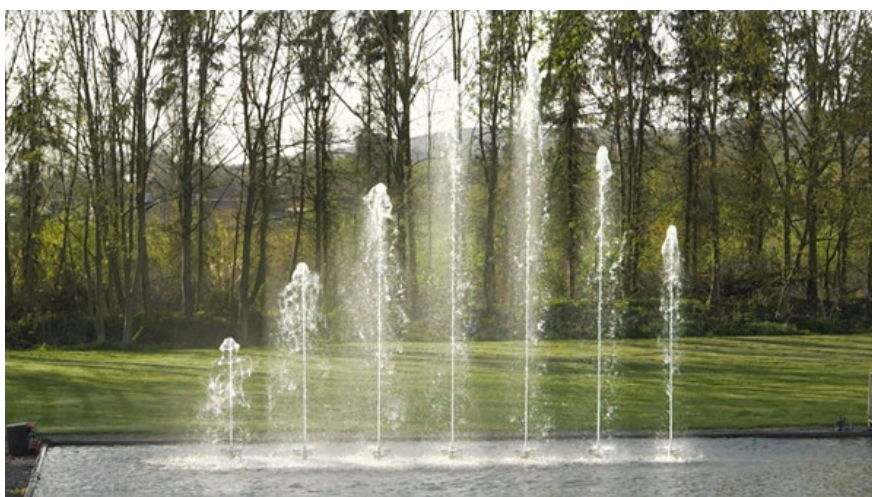
Efekt fali – Wave Effect – H_{\max} = 1,5\text{m}