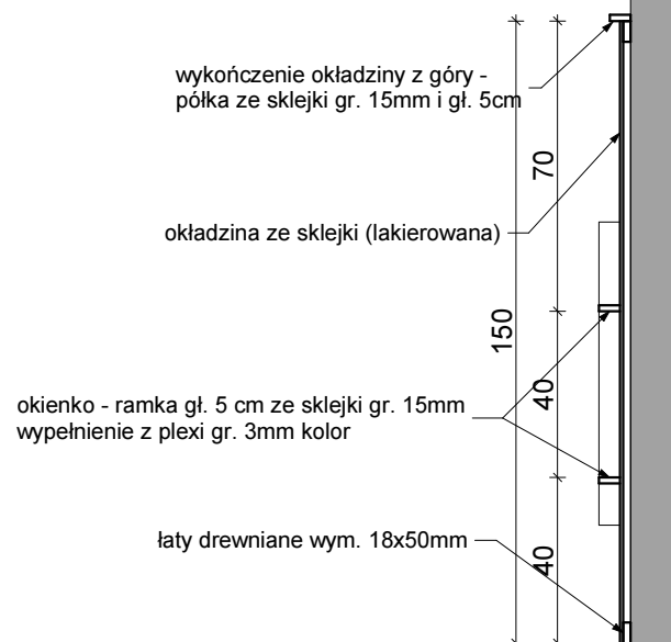
KĄCIK DZIECIECY przekrój 1-1