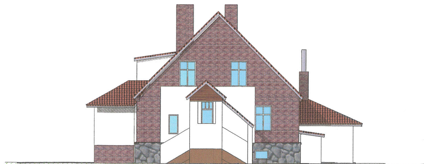
ELEWACJA SZCZYTOWA 2