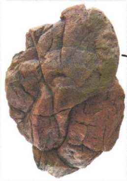
SS-02 KAMIEŃ STĄDOWY