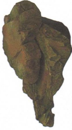
PREFABRYKOWANE ELEMENTY STRUMYKA- OGRODY. ROZKŁ. PL