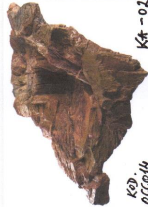
KOD. KA-02 OCCO14 KASKADĄ OGRODOWĄ