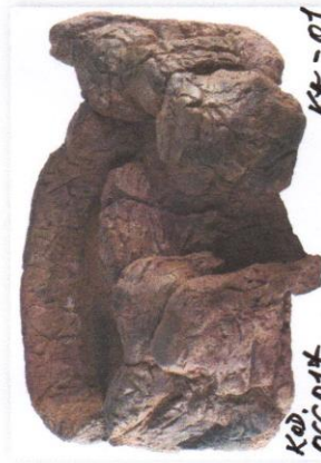
KOD. KA-01 OCCO14 KASKADĄ OGRODOWĄ