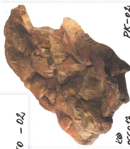
KOD PK-02 OCCO13 POTOK OGRODOWY