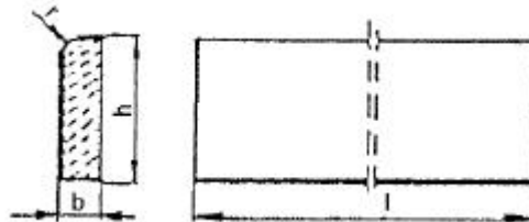
Rysunek 1. Kształt betonowego obrzeża chodnikowego