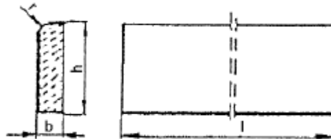
Rysunek 1. Kształt betonowego obrzeża chodnikowego