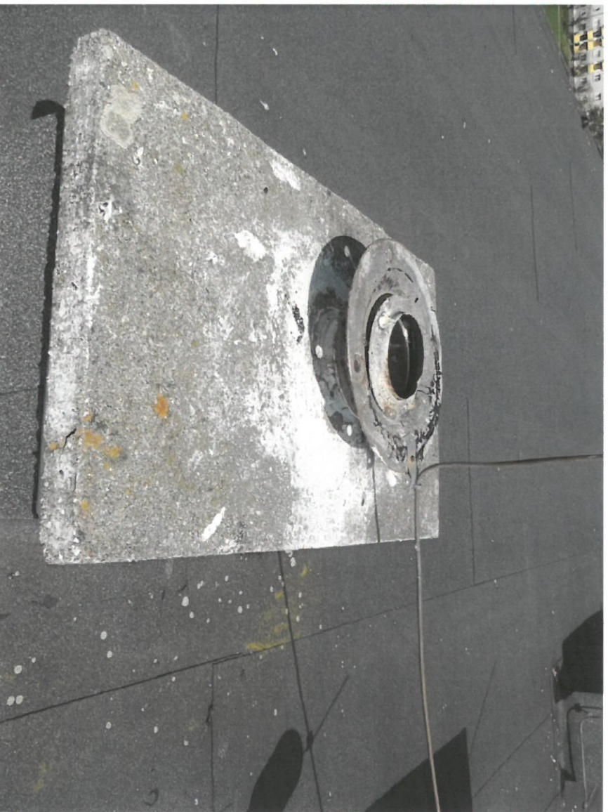
Zdjęcie Nr 12

Widok na dach budynku głównego. Widok na kominiek wentylacyjny i wywiewczak cylindryczny.