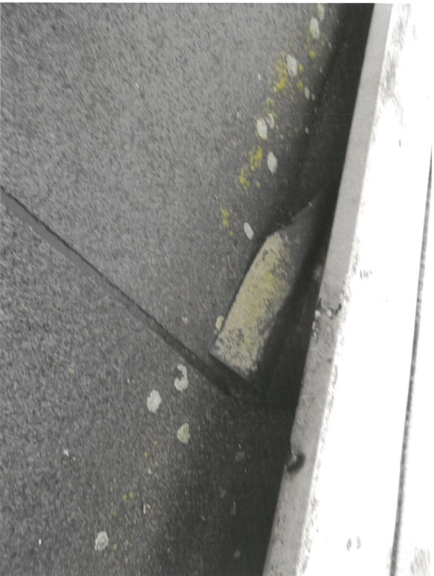
Zdjęcie Nr 13

Widok na dach budynku głównego. Widok ogniomur.