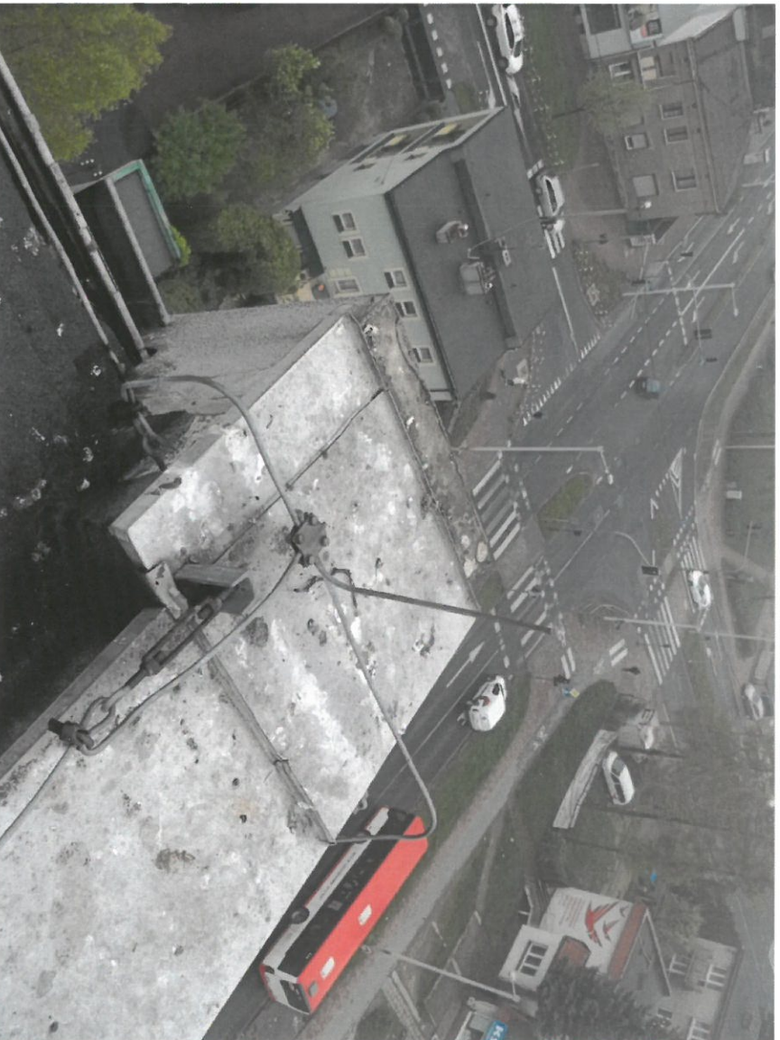
Zdjęcie Nr 16

Widok na dach budynku głównego. Widok na ogniomur.