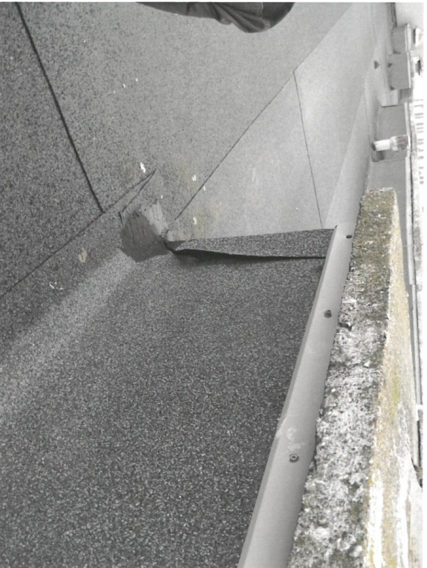
Zdjęcie Nr 14

Widok na dach budynku głównego. Widok ogniomur.