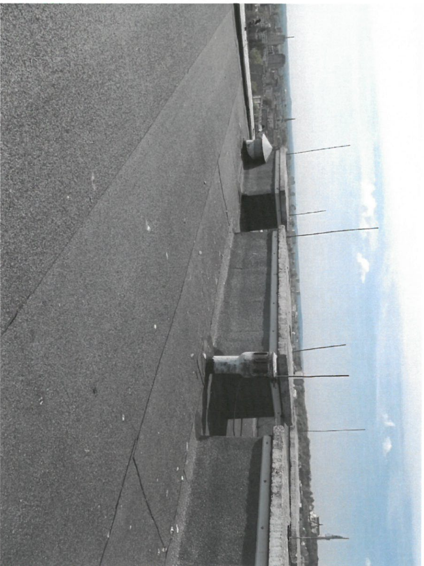
Zdjęcie Nr 11

Widok na dach budynku głównego. Widok na kominiek wentylacyjny i wywiewczak cylindryczny.