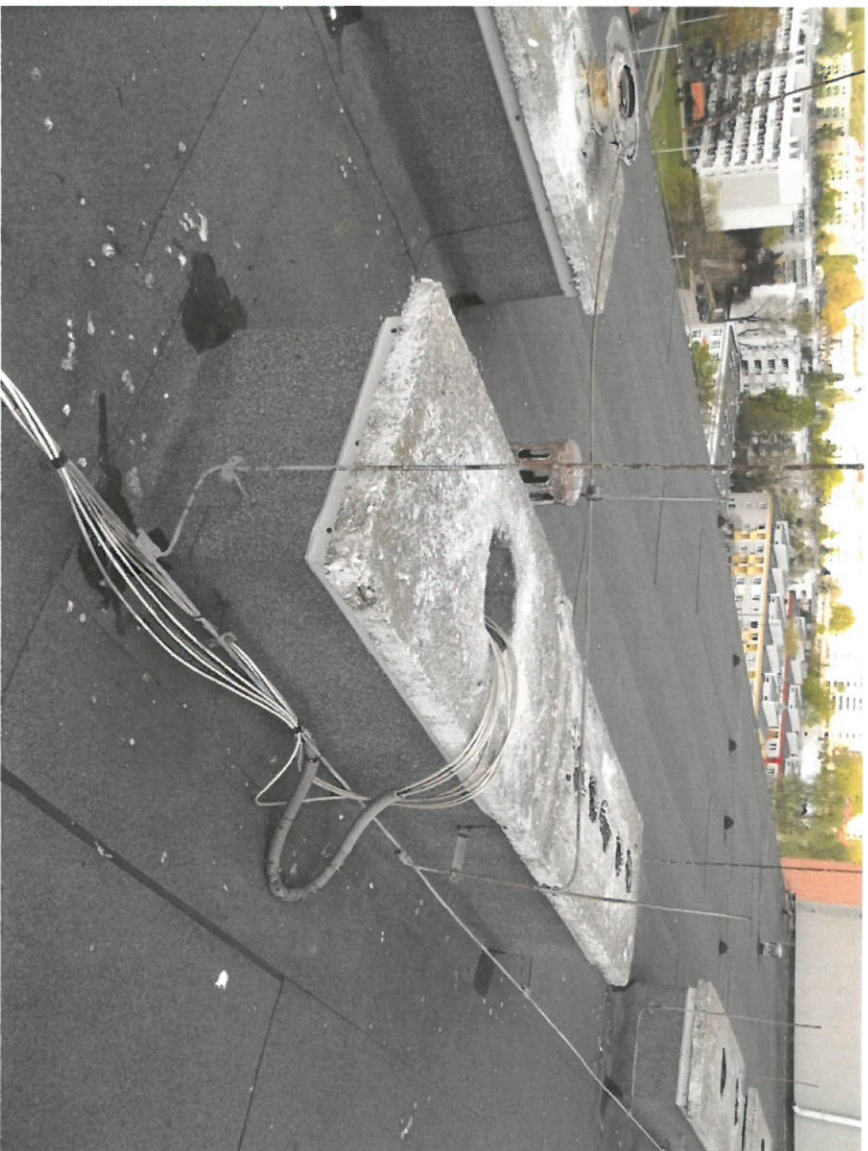
Zdjęcie Nr 13

Widok na dach budynku głównego. Widok na kominy wentylacyjne.