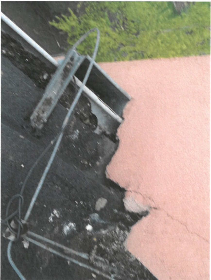
Zdjęcie Nr 15