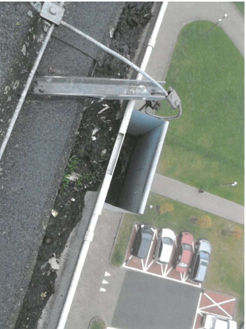
Zdjęcie Nr 13

Widok na dach budynku głównego. Widok na kominy wentylacyjne.