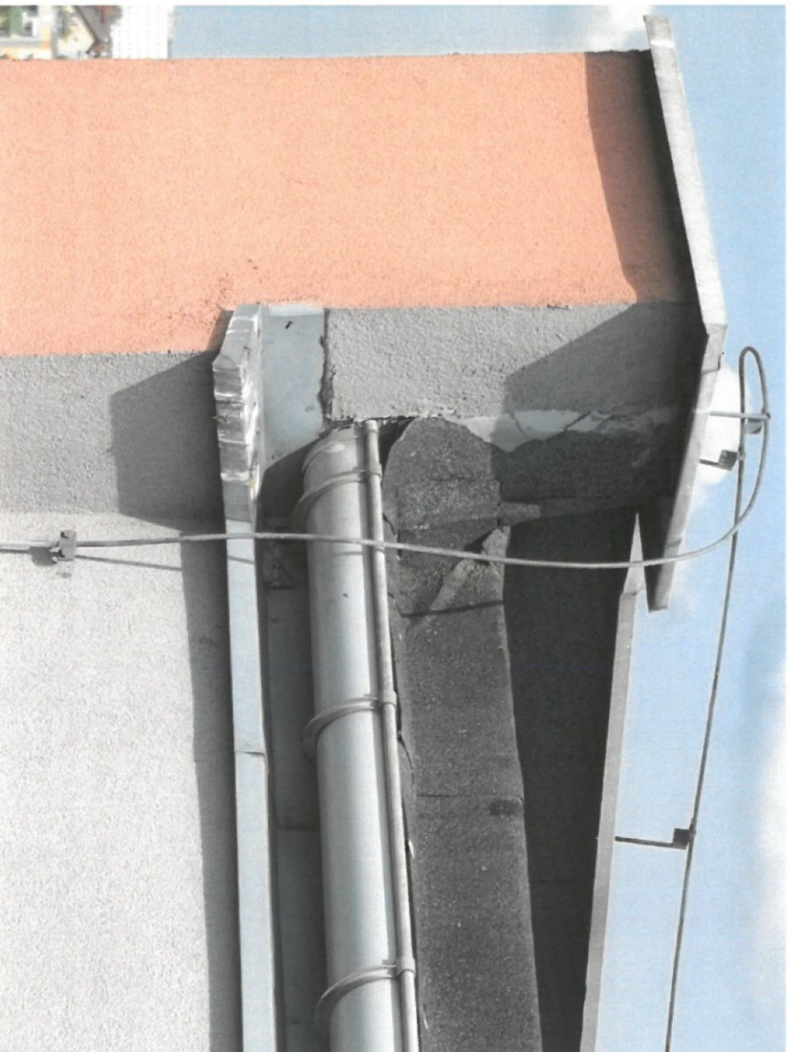
Zdjęcie Nr 6 - Widok na część wysoką przekrycia – Maszynownia ;widok na odwodnienie dachu

Widoczna antena TV, instalacja odgromowa, odwodnienie dachu.