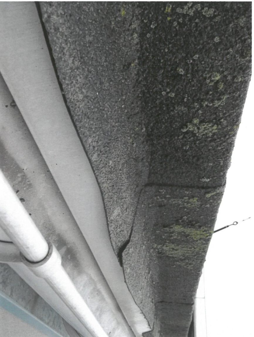
Zdjęcie Nr 8 - Widok na część wysoką przekrycia – Maszynownia ;szczegół odwodnienia dachu