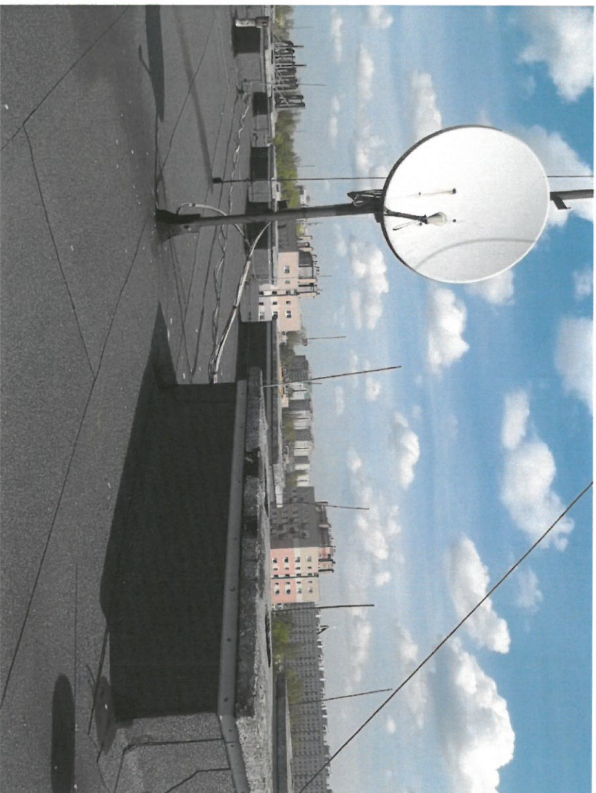
Zdjęcie Nr 9

Widok na dach budynku głównego. Widoczna antena TV, instalacja odgromowa, kominy wentylacyjne.